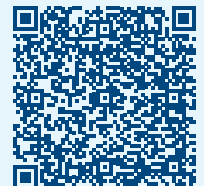
Vidéo sur le fonctionnement†