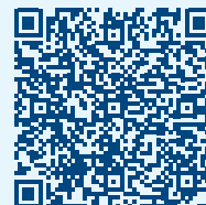
Vidéo sur les fonctionnalités†

Pour passer à l'étape suivante de votre parcours de traite, contactez votre concessionnaire DeLaval ou pour plus d'informations, visitez-nous sur www.delaval.com